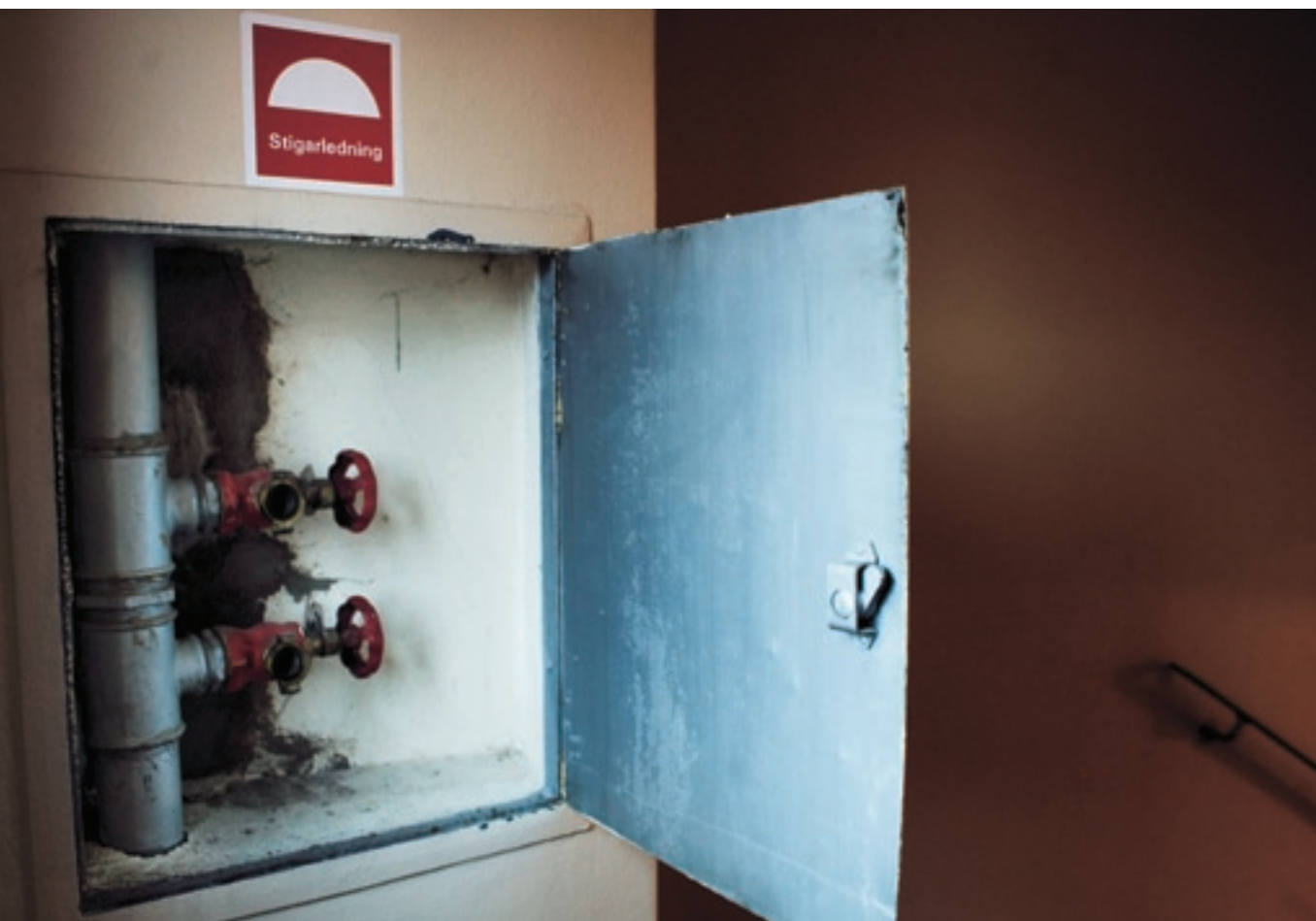
Via stigarledningen i trapphuset får räddningstjänsten vattenförsörjning utan att behöva dra slangar hela vägen från bottenvåningen.