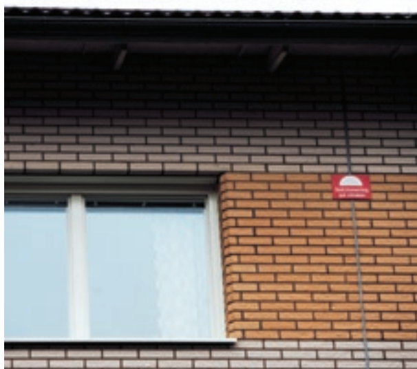
Tips: Om byggnaden har brandsektionerad vind är det en bra idé att ha skyltar med texten "Sektionering på vinden" uppsatta på fasaden där sektioneringarna finns. Då ser räddningstjänsten direkt var de är.

Observera att brandsäkerheten i äldre trähus vanligtvis är mycket sämre eftersom dörrar och väggar inte är utformade för att klara en brand på samma sätt som i nyare byggnader. Exempelvis kan en brand snabbt ta sig genom en tunn spegeldörr i trä. Har dörren dessutom glasrutor, kan branden sprida sig ännu fortare. I sådana hus är brandskyddet särskilt viktigt. Eventuellt bör förstärkningsåtgärder övervägas. En sådan kan vara att byta ut eller förstärka lägenhetsdörrarna.