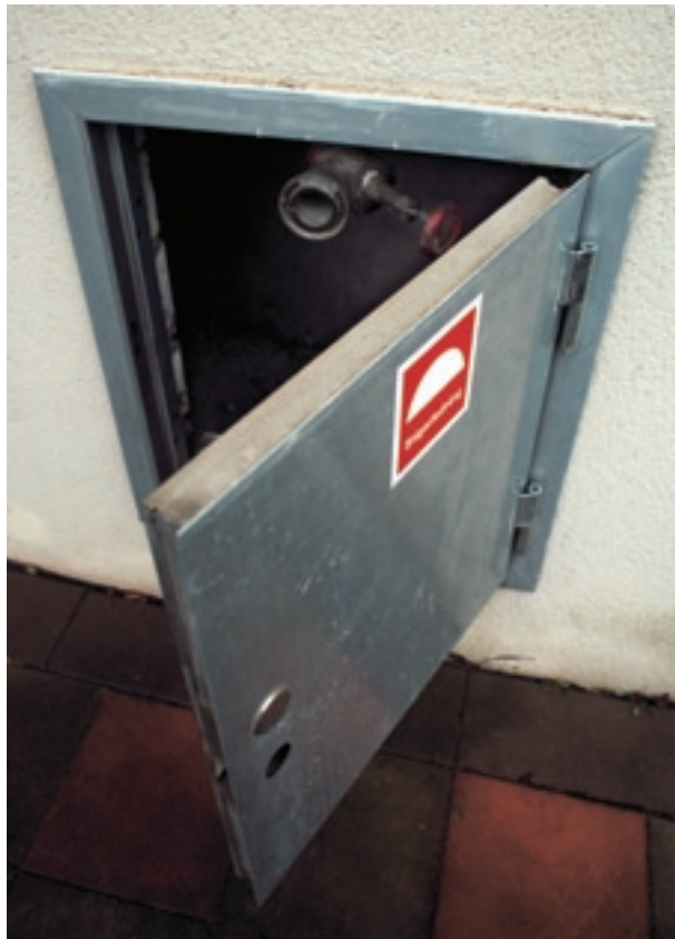
I stigarledningen i luckan på fasaden kan räddningstjänsten koppla in vatten. Inne i trapphuset finns sedan uttag där slangar kan anslutas.

I trapphus utgörs brandventilationen ibland av vanliga öppningsbara fönster. Det är viktigt att se till att lekande barn inte kan falla genom dessa. För att hindra olyckor kan exempelvis ett utvändigt galler användas.