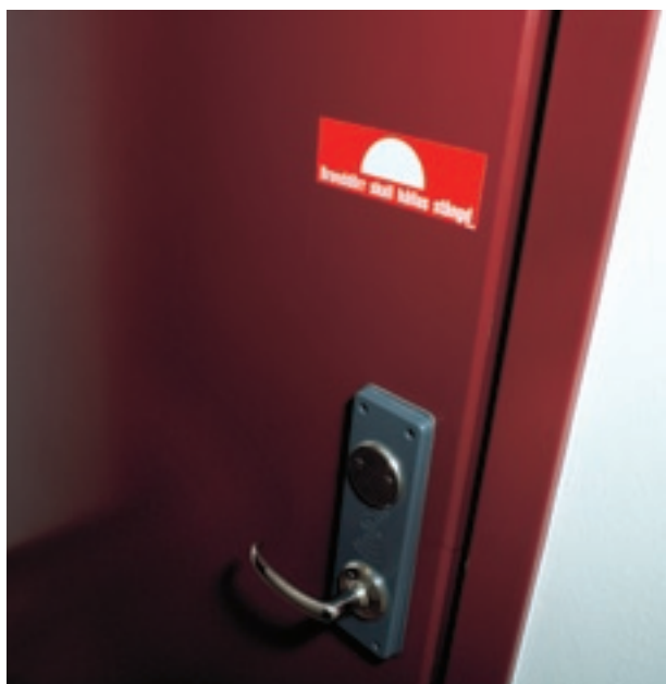
Det är mycket viktigt att branddörrar hålls stängda. De får inte ställas upp med kilar eller dylikt.