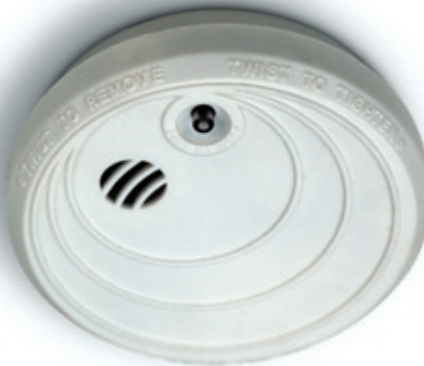
Det ska finnas minst en uppsatt och fungerande brandvarnare i varje lägenhet. Billigare liv- och egendomsförsäkring är svårt att hitta.

En brandvarnare är en billig livförsäkring som varnar snabbt och räddar liv. En tidig upptäckt ger också större möjligheter att begränsa konsekvenserna av branden. I varje bostad ska det finnas minst en fungerande brandvarnare. Finns det någon hörselskadad i bostaden måste behovet av tidig larmning vara tillgodosett även för denne. Det kan exempelvis ske genom att brandvarnaren förses med särskild ljus- eller vibrationsfunktion. En brandvarnare täcker cirka 60 kvadratmeter. Är lägenheten större än så behöver fler brandvarnare installeras. Om bostaden har flera våningsplan bör det finnas brandvarnare på varje våning. Enligt Räddningsverkets allmänna råd om brandvarnare i bostäder, är det lämpligt att ägaren till byggnaden ser till att brandvarnare installeras, men att de boende sedan själva ansvarar för att regelbundet prova att den fungerar och byta batterier vid behov.